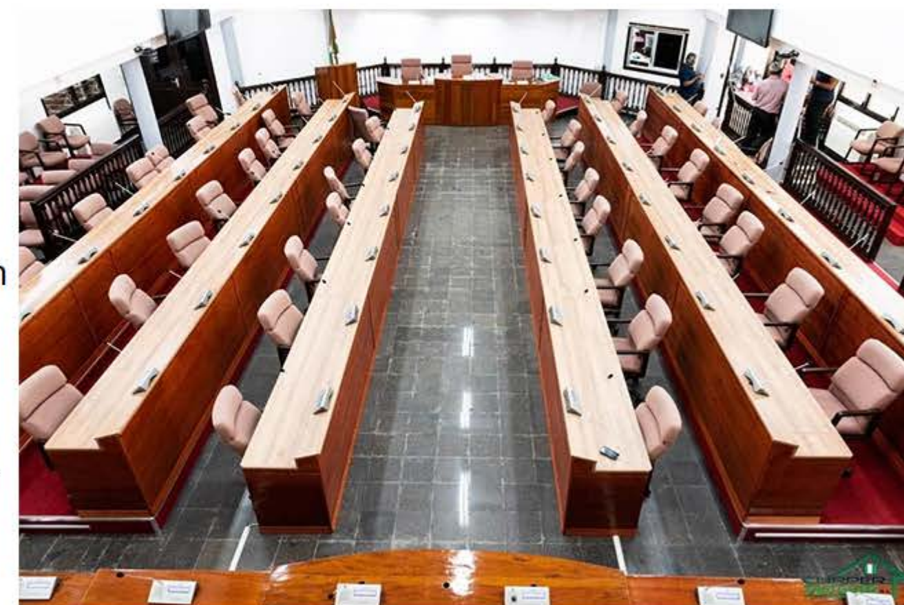
De vergaderzaal van De Nationale Assemblee is opnieuw ingericht, rekening houdend met Covid-19. In plaats van twee rijen, zijn er nu drie. De ruimte is beter benut.